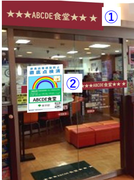
< 飲食店 > 感染防止徹底点検済証